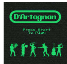
D'Artagnan: Press Start To Play, 2013