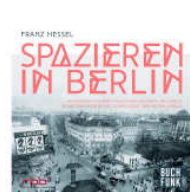
COB: Spazieren in Berlin, 2014 Buchfunk, Leipzig