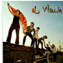
El Viento, 2008