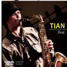
Tian Live, 2008 (Video-DVD)