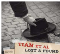
Tian et al: Lost & Found, 2012 NCD 4056